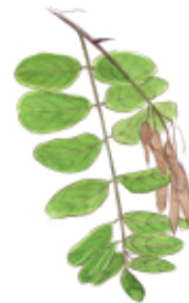
Robinier faux acacia