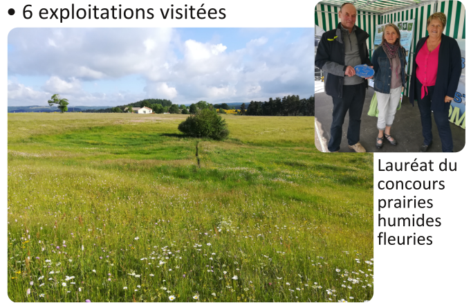
Lauréat du concours prairies humides fleuries