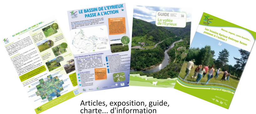
Articles, exposition, guide, charte... d'information