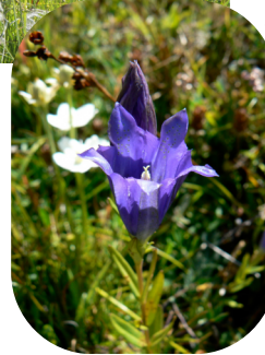
Gentiane des marais