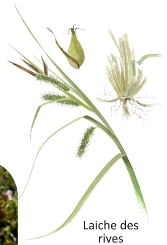
Laiche des rives