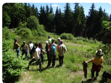
Visite de la tourbière de Chanal