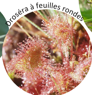
Droséra à feuilles rondes