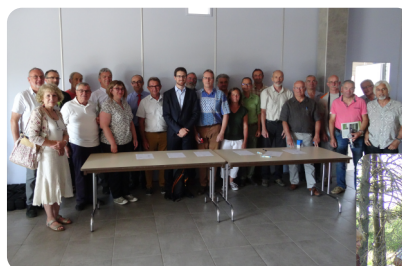
Les 24 signataires de la Charte 2017

→ Suivre et accompagner les actions menées, les études