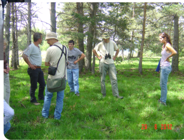
Visite technique de la zone humide de St Christol