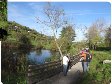
et de la zone humide de Pré Lacour