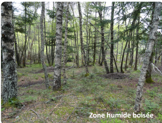
Zone humide boisée