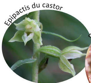
Epipactis du castor